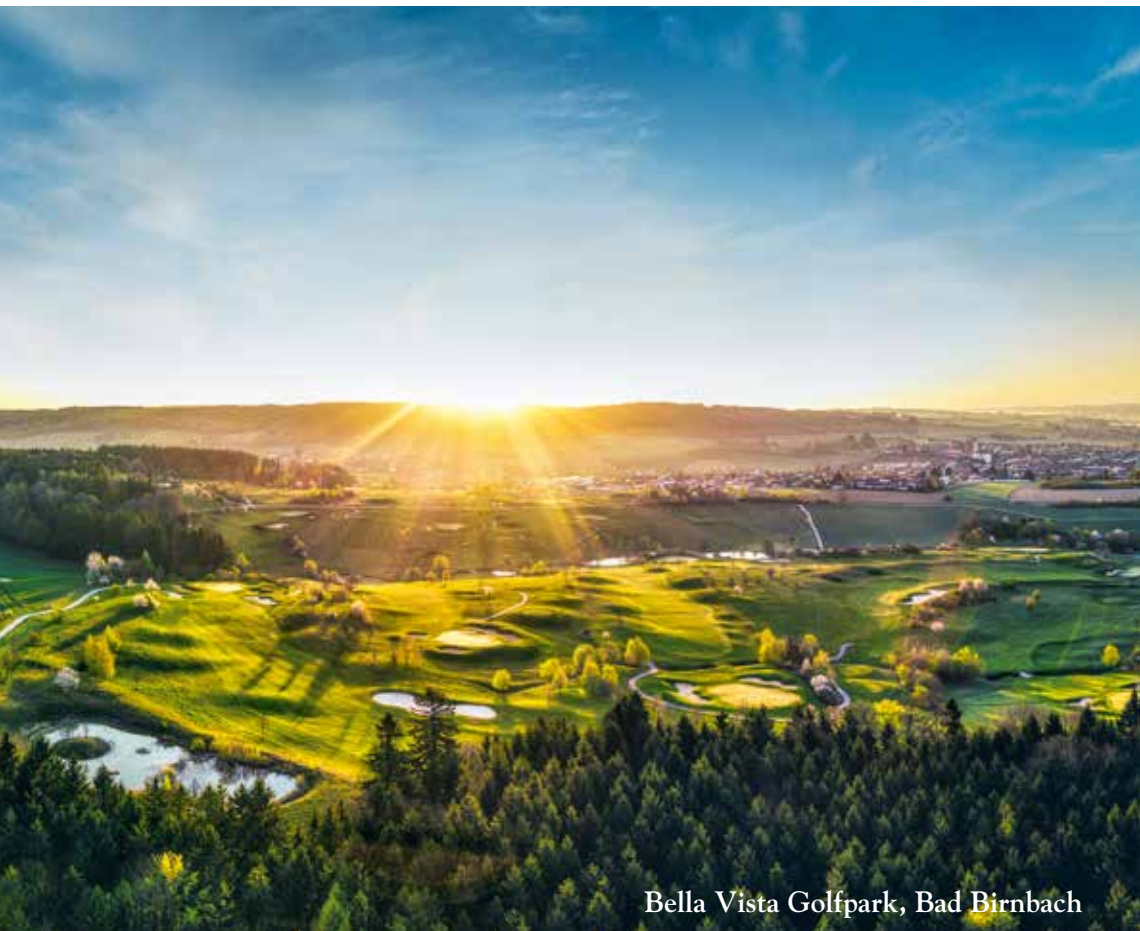
Bella Vista Golfpark, Bad Birnbach